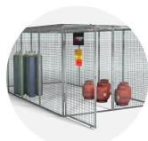
Gorilla Gas Cage GGC14