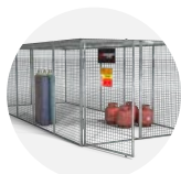
Gorilla Gas Cage GGC15