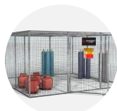
Gorilla Gas Cage GGC16