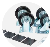
Kit roulettes CASS1