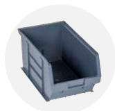
Bac à bec FCB

Remarque : toutes dimensions et poids sont approximatifs.