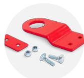
Anneaux de levage CLEK